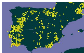
Distribuição da espécie na Península Ibérica, in https://www.gbif.org/species/7066548