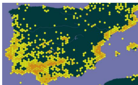
Distribuição da espécie na Península Ibérica, in https://www.gbif.org/species/3180085