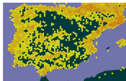
Distribuição da espécie na Península Ibérica, in https://www.gbif.org/species/2769766